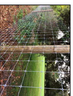
Clôtures donnant sur les espaces naturels ou agricoles : grillage à maille souple / poteaux Hauteur maximale 2,20m