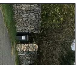
Mise en place d'un muret technique au droit des accès aux lots - parement en pierre