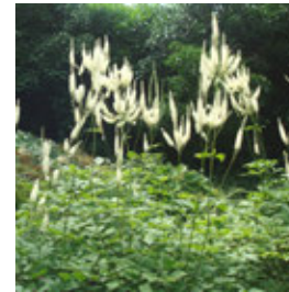
Actaea simplex 'Prichard's Giant'