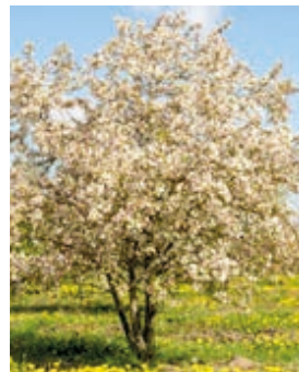
Malus « evereste »