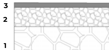
Coupe de voirie (sans échelle)