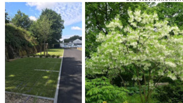
Exemple de mise en œuvre de dalles engazonnées pour des stationnements