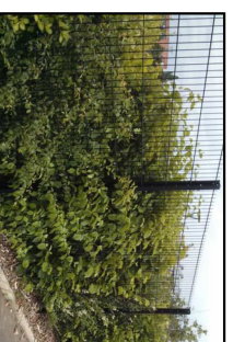
Clôtures grillagées doublées d'une haie vive. Hauteur maximale 2,20m

Traitement des clôtures sur limites séparatives :