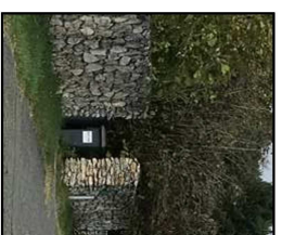
Mise en place d'un muret technique au droit des accès aux lots - parement en pierre